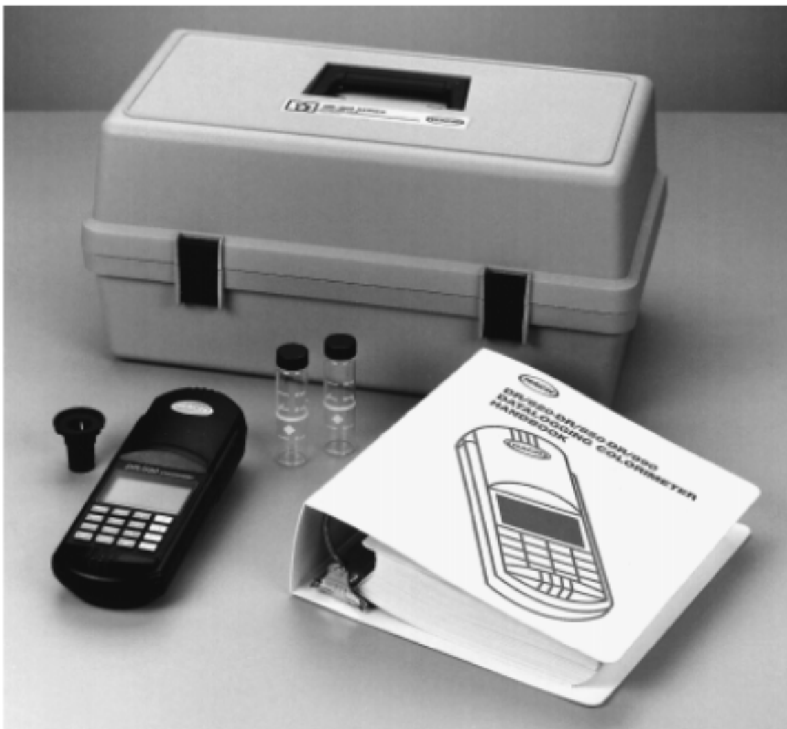
图 1 DR/800 系列色度仪标准包装*